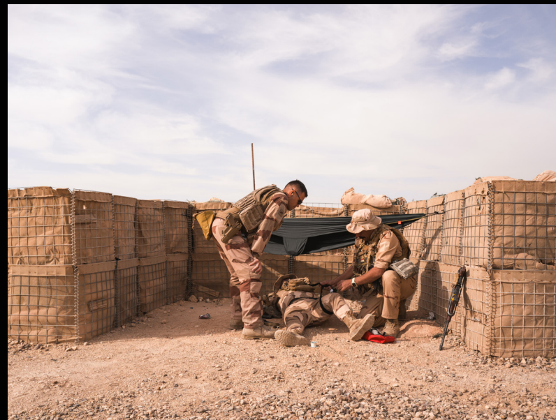
Un Irakien effectue des gestes de premiers secours lors d'un exercice sous la supervision d'un légionnaire.