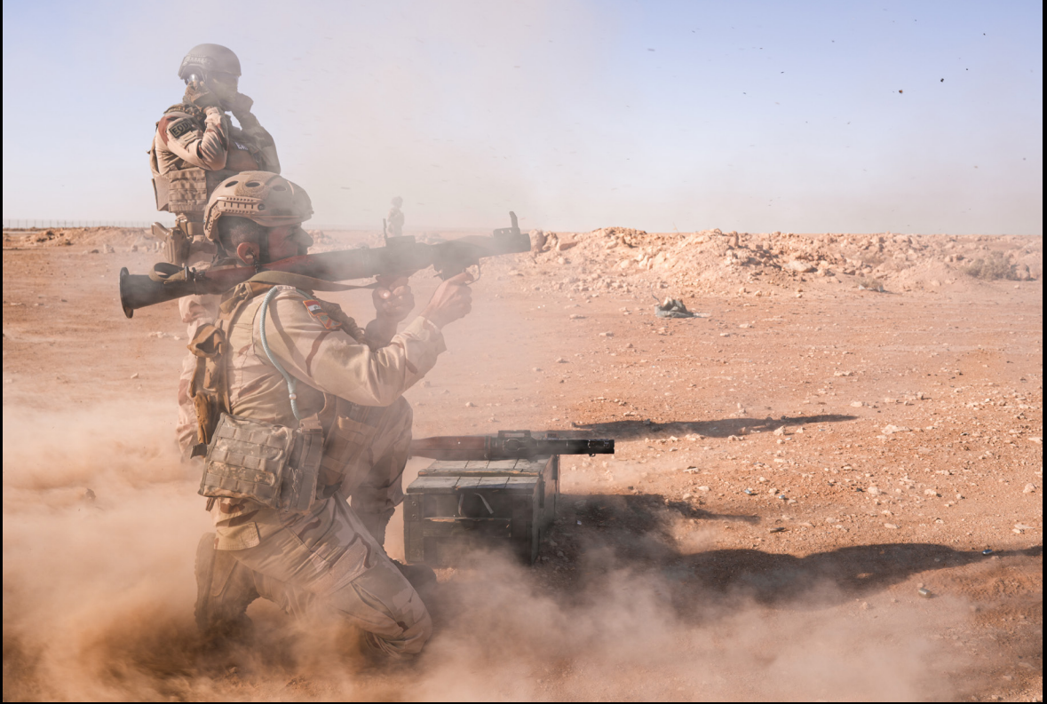
Séances de tirs au RGP-7 et à l'AK47