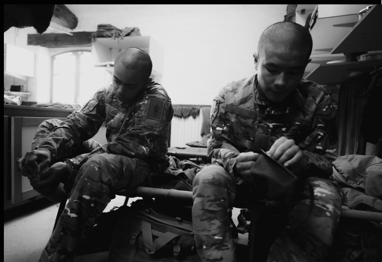
Des engagés volontaires se percent des ampoules à l'aide de l'épingle de leur béret.