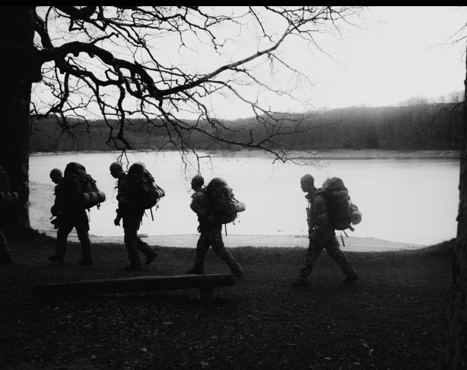
Les apprentis légionnaires marchent avec plus de 20kg sur le dos sur une distance de 30km.