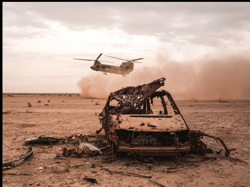
Posé d'un Chinook sur le camp de manœuvre irakien. La carcasse de véhicule sert de cible lors des séances de tir.

L'armée de Terre, au travers de la Task Force Lamassu, est un acteur déterminant du renforcement des capacités de l'armée irakienne. Dans la lutte discontinue qu'est celle contre le terrorisme en milieu désertique, la TF pour remplir sa mission, forme des « bataillons du désert » irakiens.