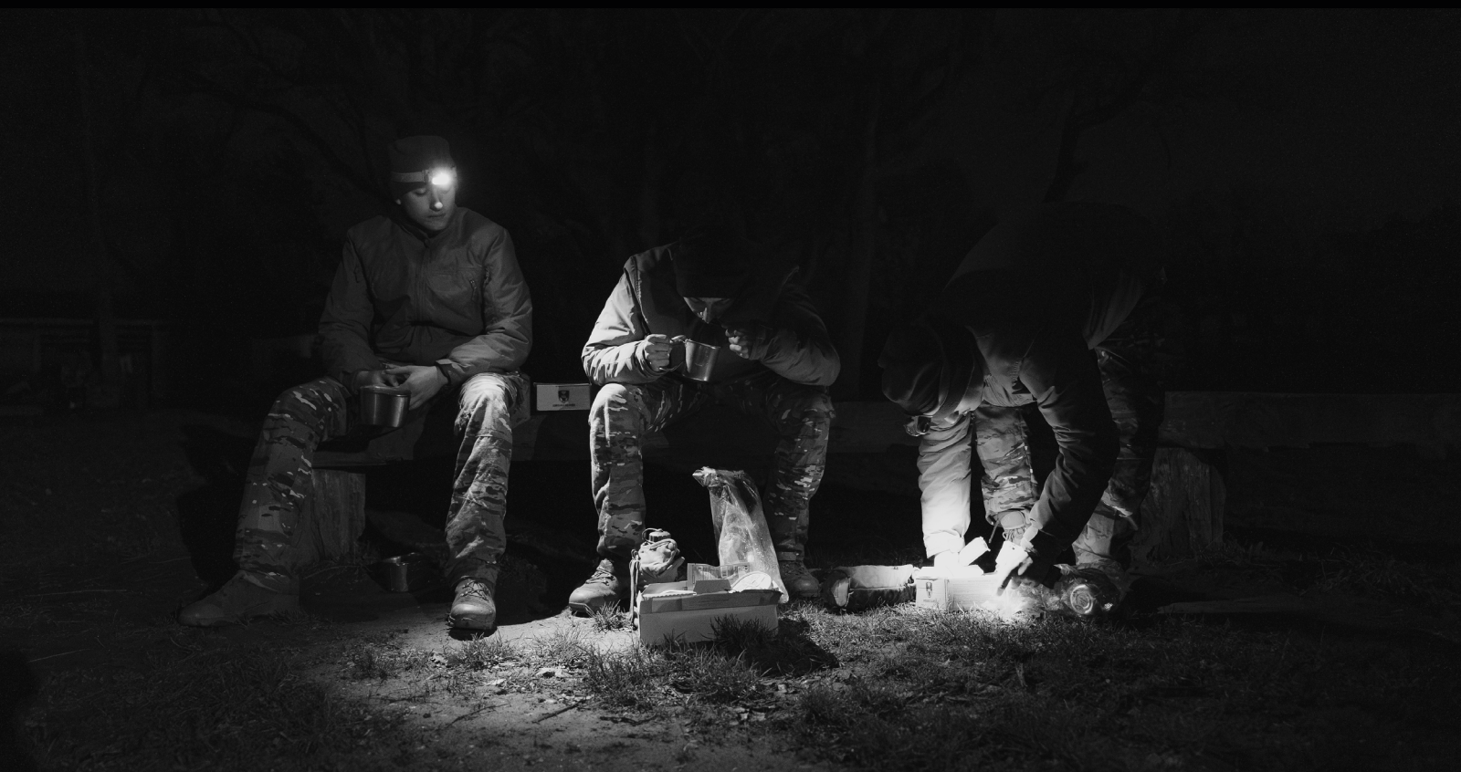
Un trinôme mange ses rations de combat.